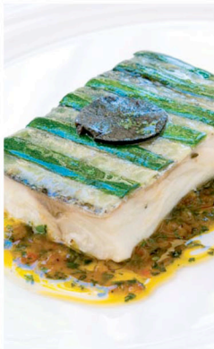
Havabor inspirert av Passetads bestemor Lucie.