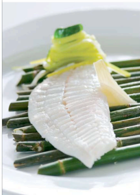
Delikat piggyar slik den serveres på Le Petit Nice.