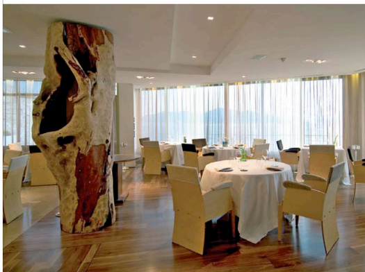
Spisesalen - et stort rundt rom - som om dagen lyses opp av det store blå havet og om kvelden av store perlemorsmuslinger.

innstilling. Og det var etter et besøk hos den store spanske chef'en Ferran Adrià.