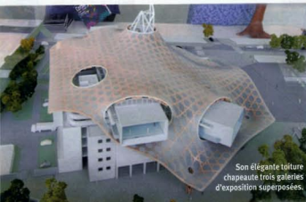
Son élégante toiture chapeauté trois galeries d'exposition superposées.

Cet étrange vaisseau spatial, conçu par les architectes Shigeru Ban et Jean de Gastines, au cœur du nouveau quartier de l'Amphithéâtre, prolonge l'aventure parisienne de Beaubourg. Il s'appuie sur ses très riches collections d'art moderne et contemporain. Son exposition inaugurale s'interrogera sur la notion de chef-d'œuvre au XX e et XXI e siècle.