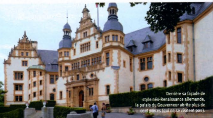
Derrière sa façade de style néo-Renaissance allemande, le palais du Gouverneur abrite plus de cent pièces (qui ne se visitent pas).

Cédée à l'Allemagne après la défaite de 1871, Metz vit la destruction de ses remparts médiévaux et la construction, aux portes de la vieille ville, d'un quartier impérial né de la volonté même de l'empereur Guillaume II. D'où une diversité de styles et de matériaux, qui autorise toutefois une certaine harmonie et une unité dans l'architecture messine. Singulières, les façades se suivent, rivalisant de formes étonnantes.