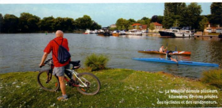
La Moselle déroule plusieurs kilomètres de rives prisées des cyclistes et des randonneurs.