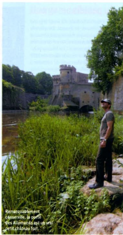
Remarquablement conservée, la porte des Allemands est un vrai petit château fort.

Superbe témoignage du Metz fortifié, la porte des Allemands, édifiée au Moyen Âge, a résisté avec succès aux assauts répétés de Charles Quint, qui en fit le siège durant trois mois, en 1552. Les remparts de la cité s'étendaient alors sur quelque sept kilomètres de long. Aujourd'hui, il ne subsiste que deux portes. Les pans restants sont l'un des lieux de promenade favoris des Messins, le long de la Seille.