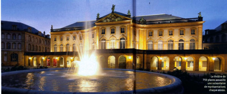
Le théâtre de 750 places accueille une soixantaine de représentations chaque année.