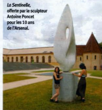
La Sentinelle, offerte par le sculpteur Antoine Poncet pour les 10 ans de l'Arsenal.

On vient pour l'admirer autant que pour y prendre son train. Dans les entrailles de la gare, on se surprend le nez en l'air à contempler sculptures et lustres. L'édifice de 300 m de long et 200 m de large est l'une des plus imposantes gares de France : construite sous l'empereur Guillaume II, elle devait permettre d'évacuer les 25 000 soldats allemands de la garnison en une seule journée. Les vieilles locos ont laissé place au TGV et la façade de style néo-roman rhénan est aujourd'hui mise en valeur avec des luminaires signés par le designer Philippe Starck.