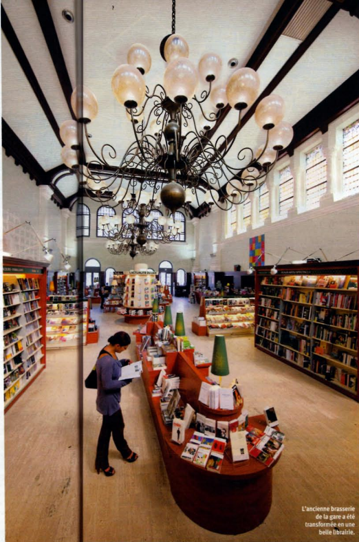
L'ancienne brasserie de la gare a été transformée en une belle librairie.