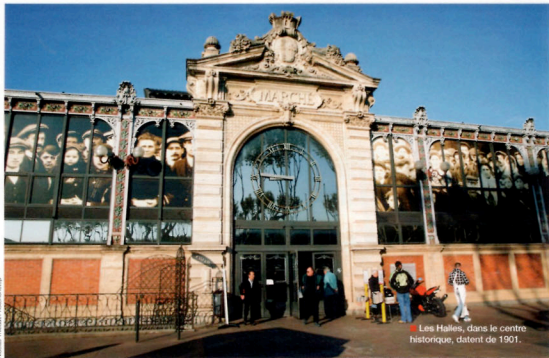
Les Halles, dans le centre historique, datent de 1901.

► la Narbonnaise : "Plutôt qu'une province, une autre Italie." Deux mille ans plus tard, l'Horreum 1 témoigne du passé antique des lieux. Le site renferme deux galeries souterraines ayant sans doute servi d'entrepôt à l'époque romaine. Au nord de celui-ci s'étendait l'ensemble du forum et du temple capitolin de Narbo Martius 2 , un complexe qui devait alors couvrir plus de 16 000 m 2 .