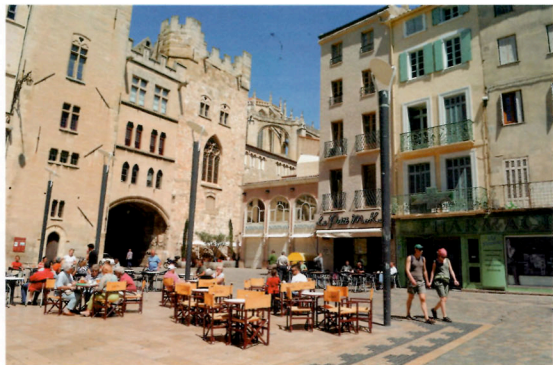
■ Le Palais des Archevêques, sur la Place de l'Hôtel de ville.

Un siècle plus tard, en juin 2008, les viticulteurs locaux manifestaient toujours... Car, autour de la ville, s'étend une mer de vignes. Où que porte le regard s'annonce ici, les Corbières, là, le Minervois, puis plus loin encore, le Fitou. Cheminant à travers les vignobles, l'ancienne voie Domitienne évo-